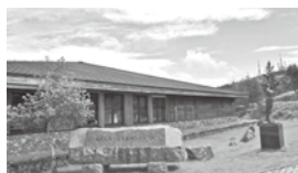
○美ヶ原自然保護センター 高原の自然・歴史・文化を分かりやすく展示しています。