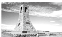
○美しの塔 高原のシンボル♪アルプスを背景に記念撮影ができる絶好のポイント。