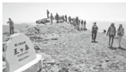
○王ヶ鼻 松本市の街並みと北アルプスのパノラマが広がる標高2,008mの絶景スポット！