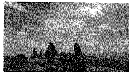
○王ヶ頭 美ヶ原の最高峰で、各種の電波塔が立ち並ぶ。山頂からは360度の大パノラマが広がる。