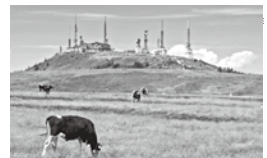
○牧場 400haの広大な牧場に、5月～10月の期間牛が放牧される。